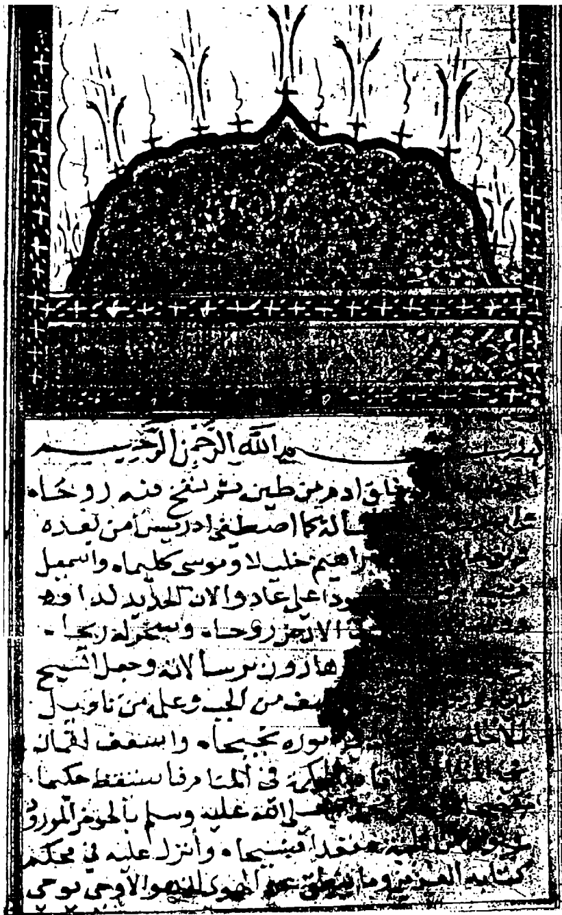
صورة الصفحة الثانية (أ) بها مقدمة الكتاب.